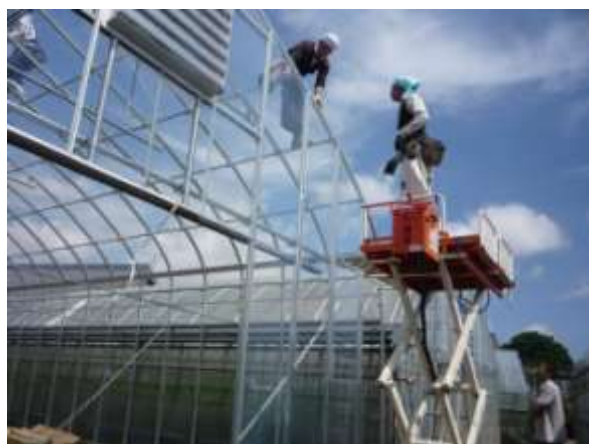
【フッ素フィルム展張風景】